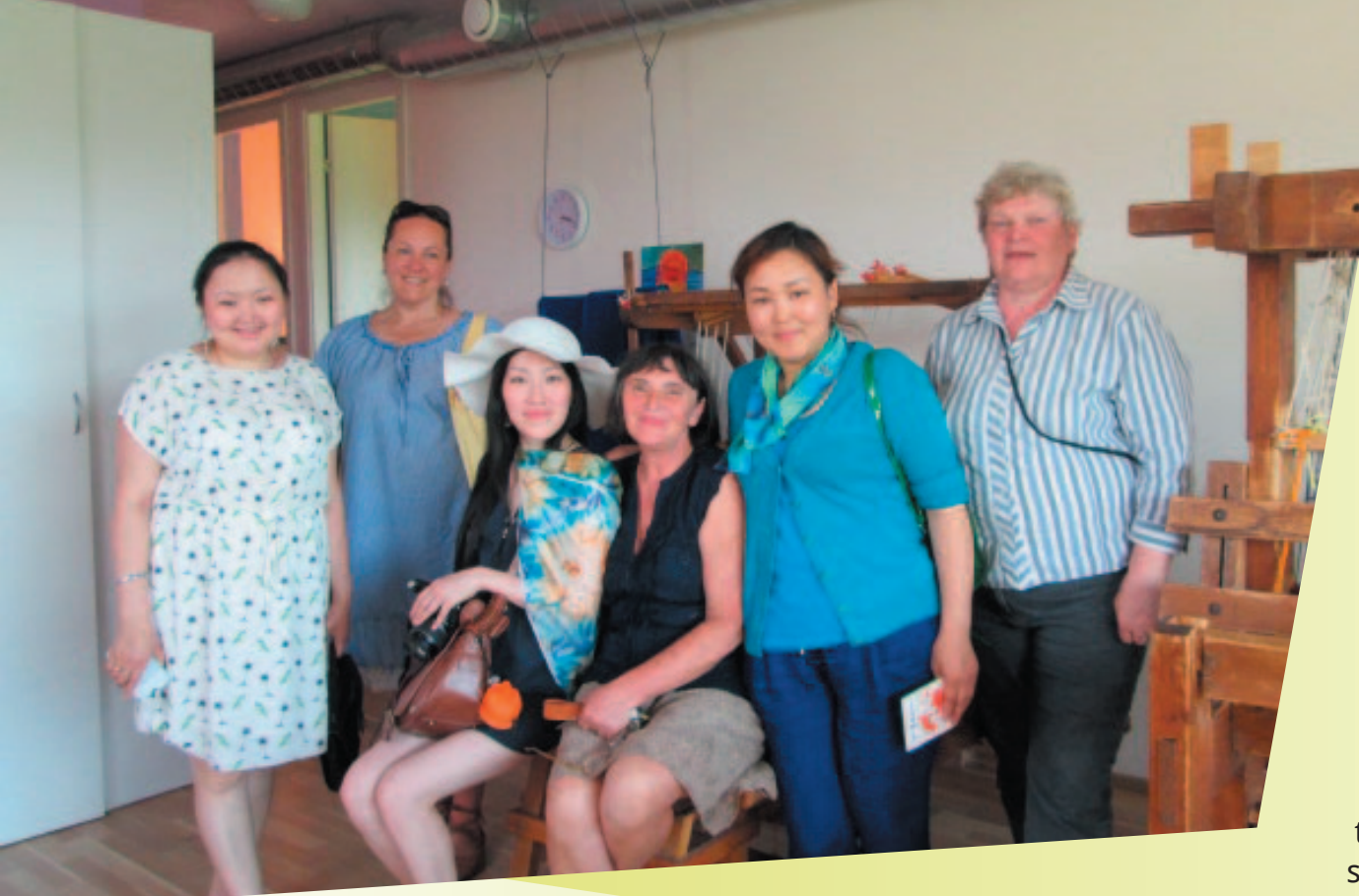
Kaugetele külalistele Jakuutiast jättis Eesti sügava mulje. Foto: Margo Orupõld.