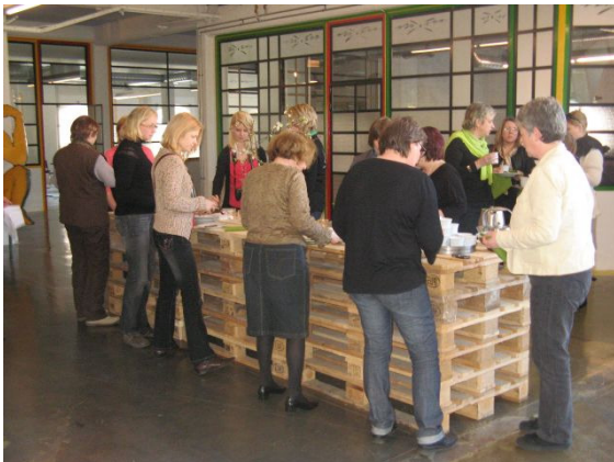
Kohvilaud oli kaetud euroalustest kokku pandud lauale.

Seminar toimus projekti raames, milles osalesid Östra Göinge piirkonna omavalitsused, Färe tööstuskeskus ja erinevad kohalikud ettevõtjad. Otsiti ühiselt võimalusi piirkonna arendamiseks. Püüti leida erinevaid võimalusi metsa ja mererandade kasutamiseks (nt. jäätis rannas), ühendades ka näiteks ehituse (NB! puuseppadest tüdrukute võrgustik) ja toidu teemad turismis. Elamusturismi võimalused (magamine, aga mida sinna juurde pakkuda – lisateenused?), metsamarjade kasutamine.