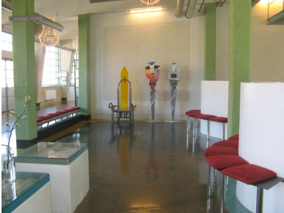
Sisekujundus on vahvalt “kiiksuga”

Seminar viidi läbi vanas paberivabrikus, mis on kohandatud ja ümber ehitatud konverentsikeskuseks. Säilitatud on osaliselt vana sisseade, lisatud mitmesuguseid taieeid, et lisada värvikust. Arendajad noored kunstnikud.